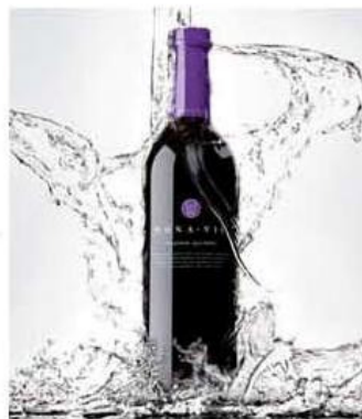
MonaVie Original

MonaVie Original, um a bebida premium que combina 19 frutas, entre elas, açai, acerola, cupuaçu, blueberry, cranberry e romã, é o presente ideal para os pais que buscam em um mesmo produto um a alternativa saudável e saborosa. MonaVie foi desenvolvido com base na filosofia de Equilíbrio, Variedade e Moderação. As frutas que compõem a fórmula exclusiva foram selecionadas por suas qualidades únicas. Juntas, porém, se complementam, resultando em um a bebida premium para o dia-a-dia. Cada gole promove o contato com a natureza dos ingredientes, deixando aquele gostinho de fruta fresca na boca. A bebida não tem adição de açúcar ou adoçantes artificiais e contém vitamina C. Por isso pode ser combinada com os mais variados tipos de alimentos e consumida a qualquer hora do dia. MonaVie Original é uma maneira inteligente e conveniente de saborear o melhor das frutas e é um a adição perfeita a uma dieta balanceada.